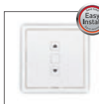
Transmisor Easy Install RF Wall-Mounted Transmitter