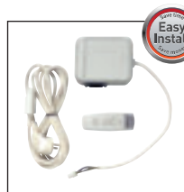
Mando a Distancia RF Plug and Play RF