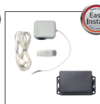
Mando a Distancia RF con Acoplamiento Inalámbrico