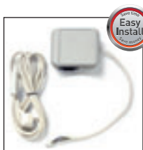
Easy Install Plug and Play Relay Box with Potential-Free Contacts