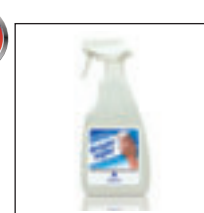
BrightSight para limpiar de forma segura la superficie de proyección