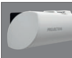
Diseño de la carcasa con forma de hoja