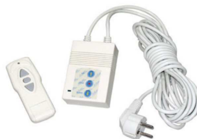
Mando a distancia RF