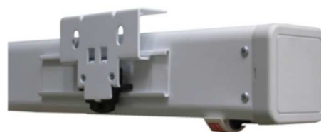
Anclajes Easy Fix