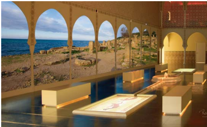
Control sala, proyección multipantalla Ramón Caus Arquitectura Visual -Factory