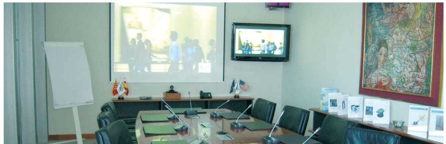
Control global en salas de juntas centralizado en consola