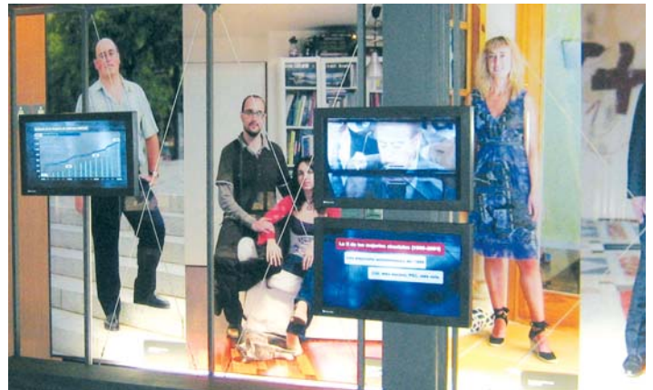
Gestión global de sala