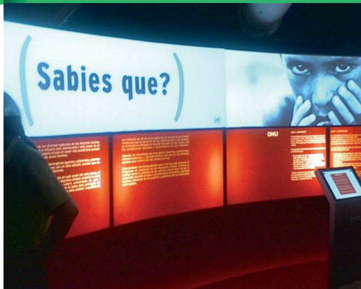
Control sala, proyección multipantalla, deformación de imagen Ramón Caus Arquitectura Visual -Factory