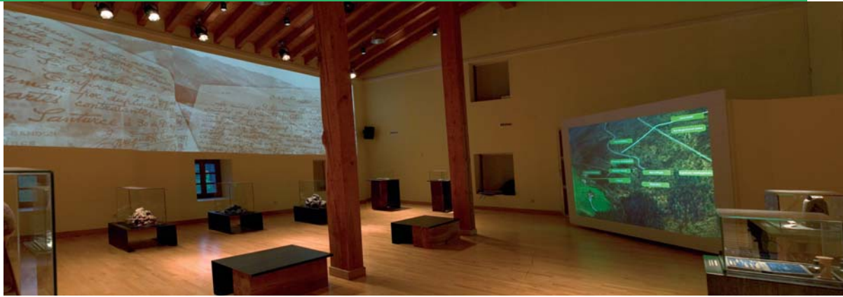
Gestión de sala, proyección multipantalla