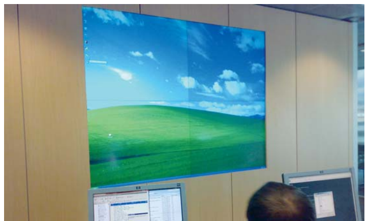
Gestión de sala y videowall